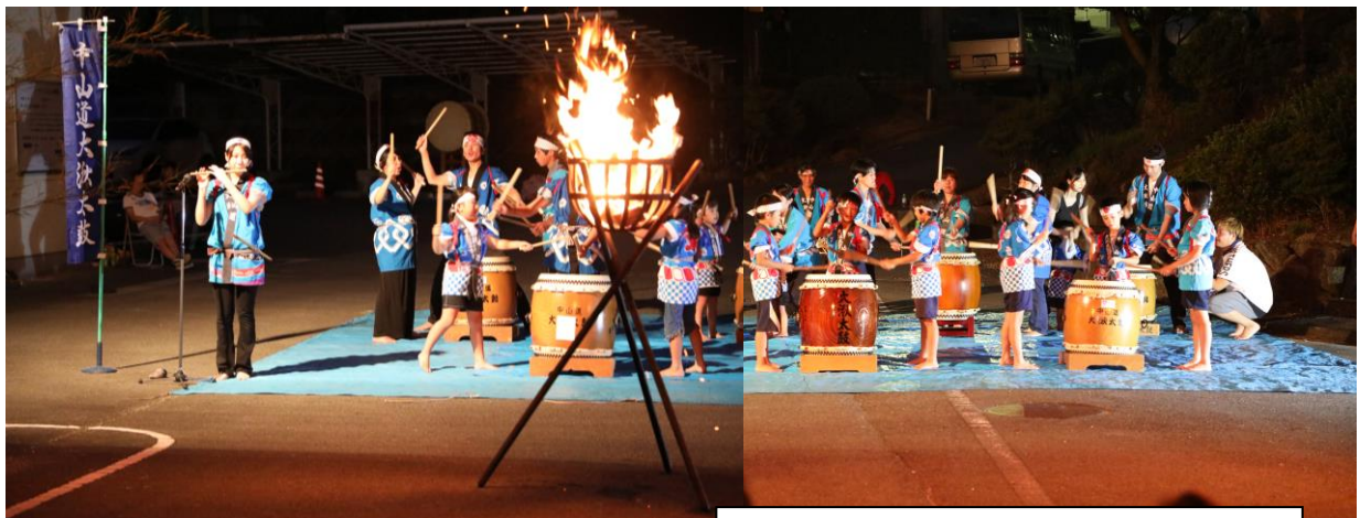
昨年の大湫病院「納涼祭」演奏から