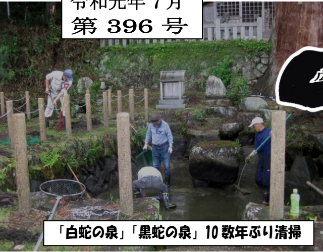
「白蛇の泉」「黒蛇の泉」10 数年ぶり清掃