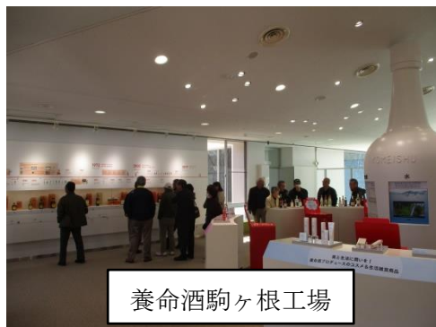
養命酒駒ヶ根工場

旅の楽しみはなんといっても食事。駒ヶ根名物「ソースカツ丼」と南信州ビールの「牛肉のビール煮」を希望によっていただきました。さて、お味はいかがだったでしょうか。