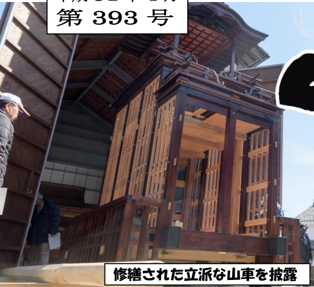
修繕された立派な山車を披露