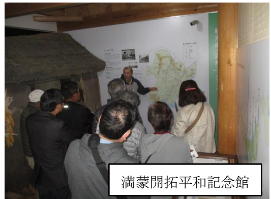
満蒙開拓平和記念館

「自分は学生の頃、夏休みにはサークル活動で人形を携えて子どもたちに見せて回った。楽しい経験でした」と参加者の一人。それぞれがいろいろな思いで、ご覧いただいたようです。