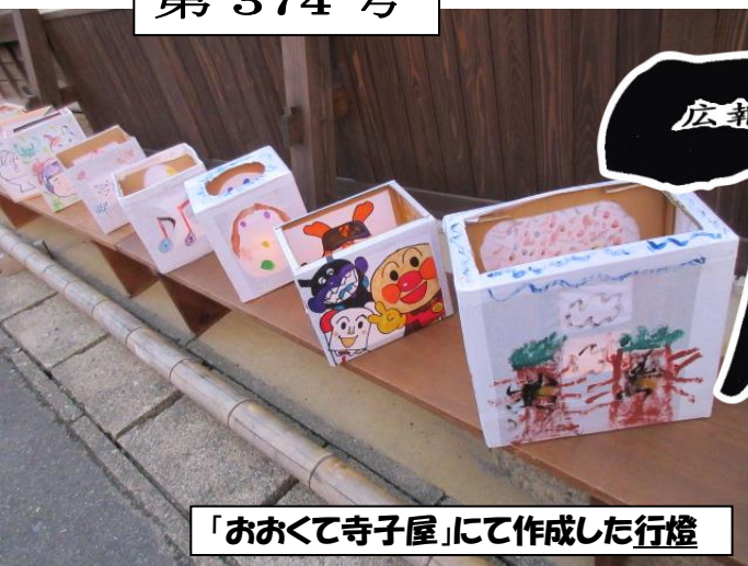
「おおくて寺子屋」にて作成した行燈