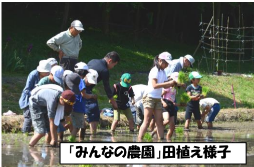
「みんなの農園」田植え様子

会行事はどう変化していくんでしょうか。親の負担が増えない様に活動が続いていくといいと思います。大変でしたが、いい経験になりました。ありがとうございました。