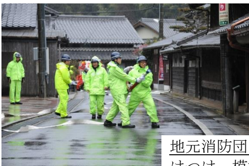
地元消防団が駆けつけ、模擬放水訓練。

*地元第三分団と市消防本部との連携による放水訓練(雨天・修復したばかりのため模擬)