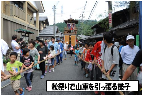
秋祭りで山車を引っ張る様子

一年間、子供会育成会会長を務めさせて頂きました。今までは子供だけが活動に参加する事が多く、私自身はあまり一緒に参加する事はありませんでした。その為分からない事も多く、役員でないお母さん方・地域の方々に沢山協力して頂き、無事終える事が出