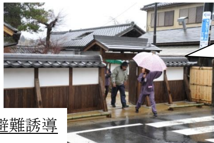
丸森職員のテキパキとした避難誘導で旧小学校グラウンドへ集合。