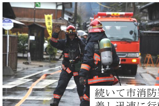
続いて市消防署が到着し迅速に行動、模擬放水開始です。