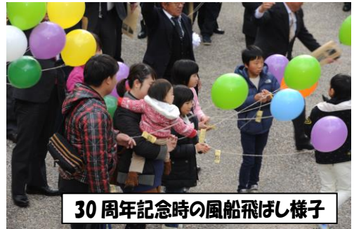
30周年記念時の風船飛ばし様子

会行事はどう変化していくんでしょうか。親の負担が増えない様に活動が続いていくといいと思います。大変でしたが、いい経験になりました。ありがとうございました。